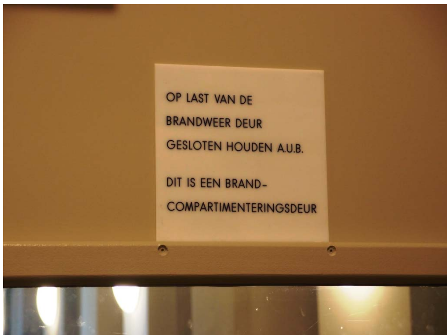
Waarschuwing op een brandwerende deur.